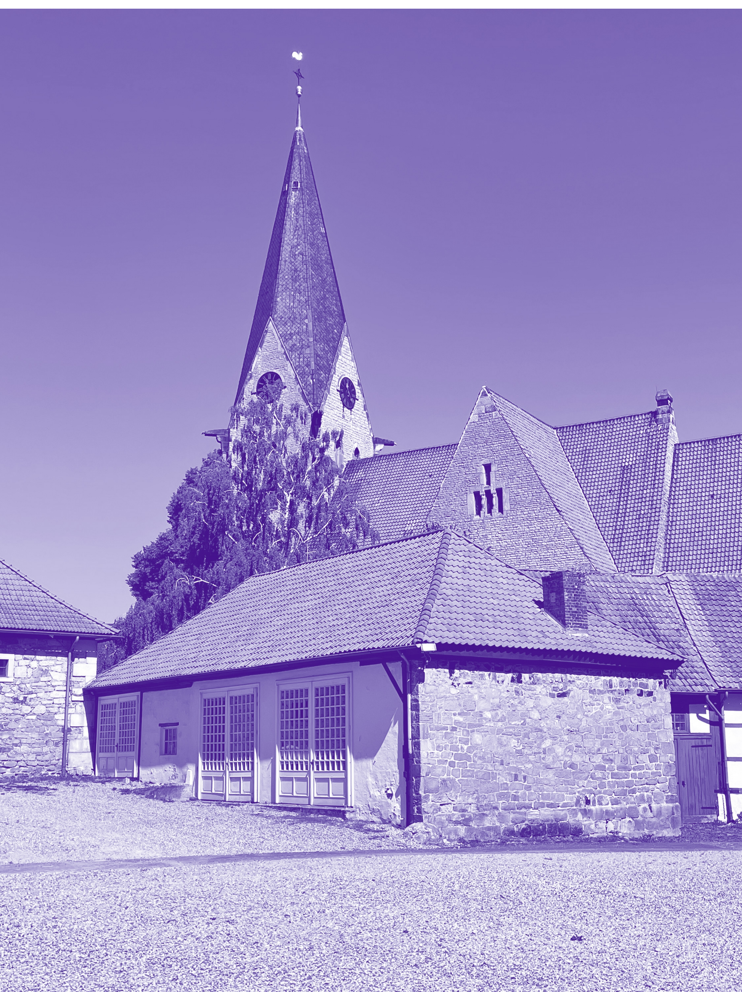
Schmiede, St. Martin Kirche im Hintergrund