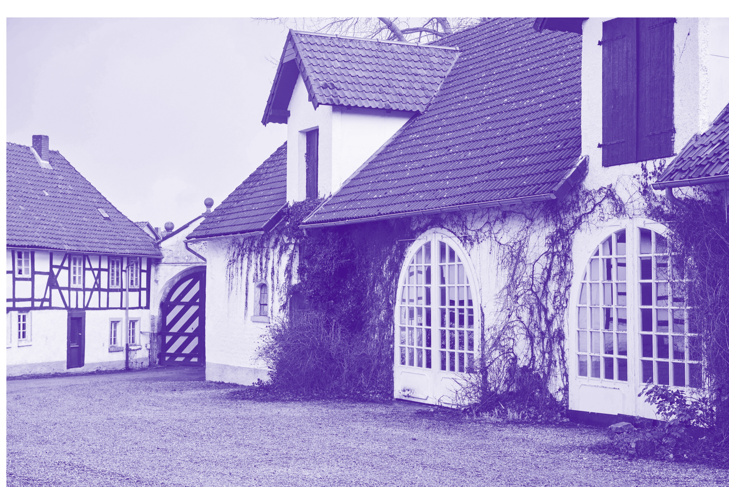
Schafmeisterwohnung, Haupteingang und Schafstall