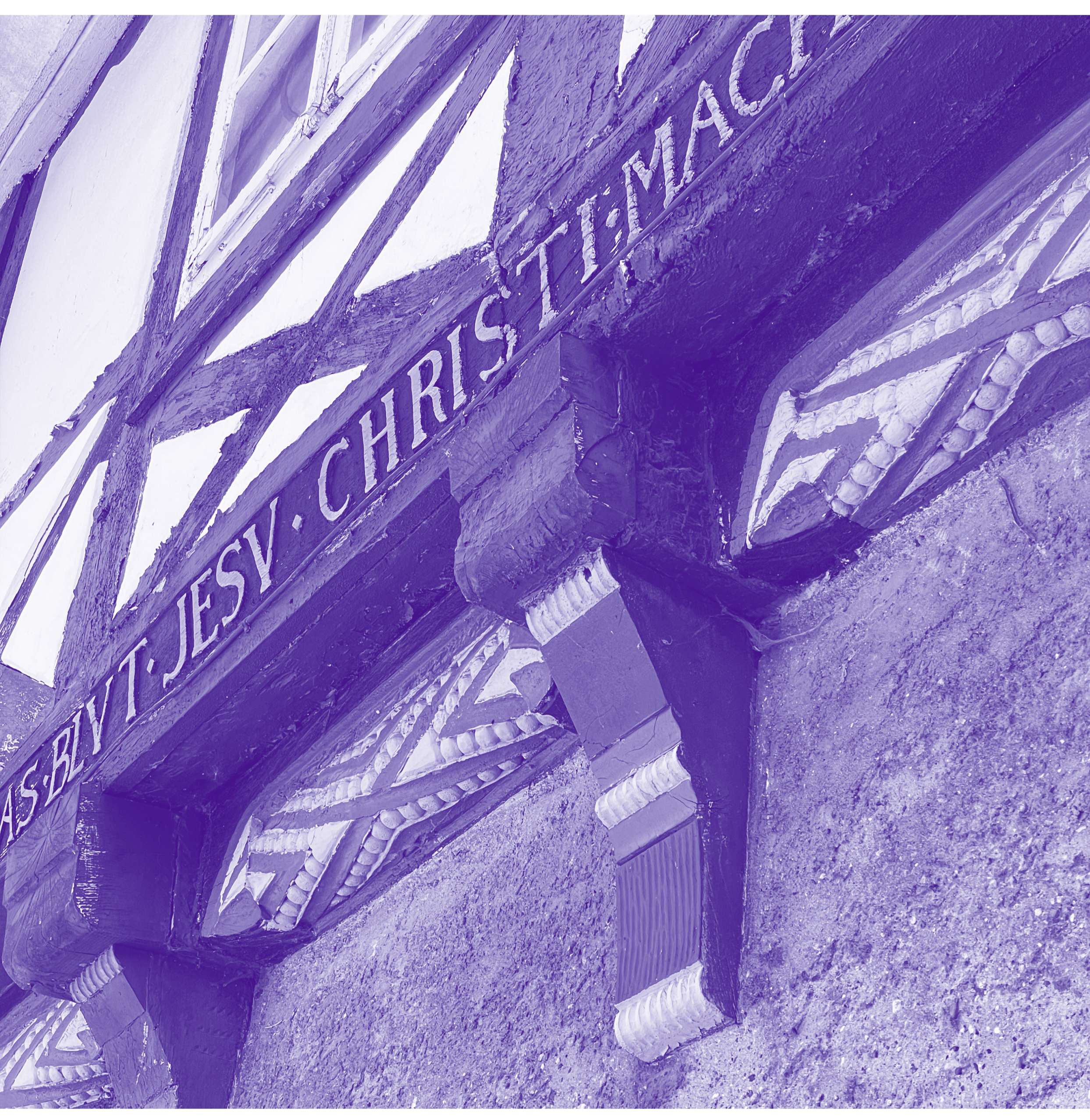
Detail des Haupthauses